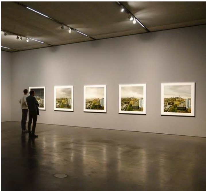
John Riddy, zaaloverzicht Photographs .

Tot 1 september toont De Pont museum een groot overzicht van het werk van de Britse fotograaf John Riddy . Sinds begin jaren negentig werkt Riddy in series, eerst in zwartwit, later ook in kleur. Karakteristiek voor zijn foto's is de verstilling. Al zijn belangrijke series zijn nu in De Pont te zien.