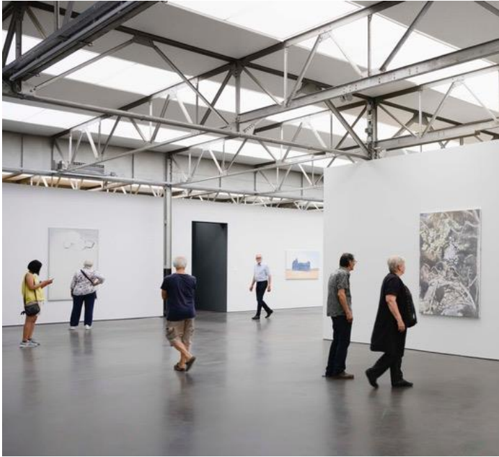
Luc Tuymans, zaaloverzicht The Return .

Tot 1 september toont De Pont museum een groot overzicht van het werk van de Britse fotograaf John Riddy . Sinds begin jaren negentig werkt Riddy in series, eerst in zwartwit, later ook in kleur. Karakteristiek voor zijn foto's is de verstilling. Al zijn belangrijke series zijn nu in De Pont te zien.