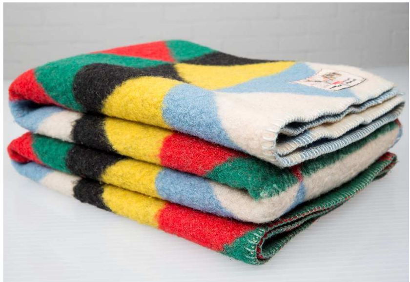
Reclameplaat AaBefabrieken, Tilburg en deken 'Prairie'