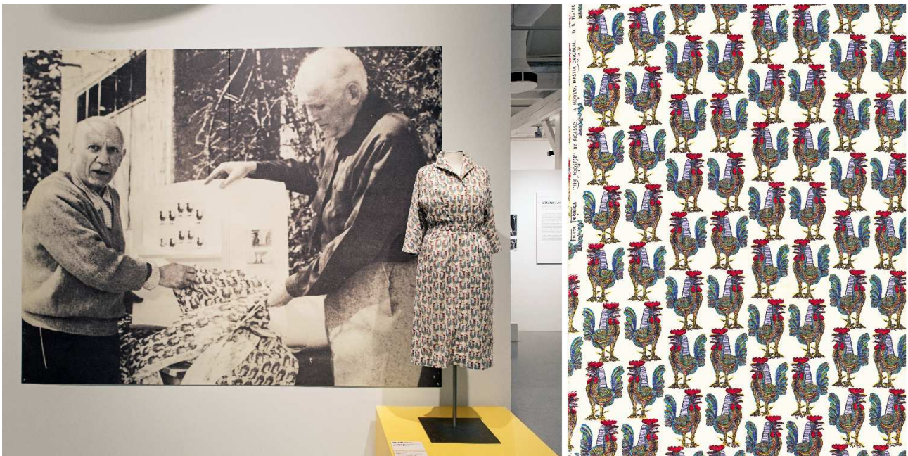
Jurk met dessin 'Rooster' van Pablo Picasso

In het TextielMuseum Tilburg werden meer dan 200 gedrukte en geweven interieur- en modestoffen, maar ook kledingstukken, uit de periode 1910 tot 1975 getoond die laten zien hoe moderne kunst voor iedereen bereikbaar werd. Er is werk te zien van gerenommeerde kunstenaars als Pablo Picasso, Raoul Dufy, Salvador Dalí, Henri Matisse, Sonia Delaunay, Marc Chagall, Henry Moore, Fernand Léger, Andy Warhol en Alexander Calder.